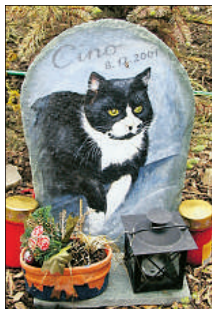
Tierfriedhof am Wisenberg in Läuelfingen (BL).

Wegen dieser Unmittelbarkeit zu Gott verwende die Bibel Tiere oft als Vorbilder. So etwa, wenn Jesus in der Bergpredigt dazu auffordere, sich im Vertrauen auf Gott an den Vögeln zu orientieren. «Sie säen nicht, sie ernten nicht, sie sammeln nicht in Scheunen – euer himmlischer Vater ernährt sie.» Hagencord geht noch weiter. «Die Tiere ernst nehmen heisst auch das Animalische im Menschen nicht verdrängen.» Wenn in der Kirche Sexualität