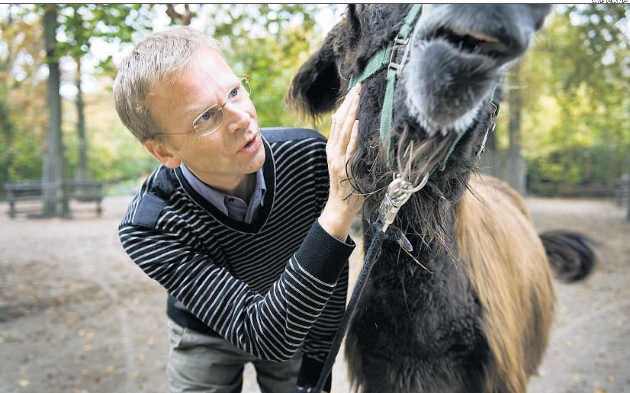
Der Priester und Biologe Rainer Hagencord widmet sich der Theologischen Zoologie. (27. Oktober 2009)

Fussball-Forschung Warum Berührungen und Küsse erfolgreich machen. Seite 49